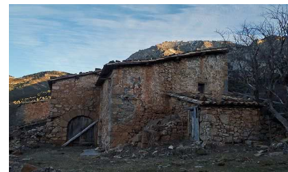
Borda del Pujol