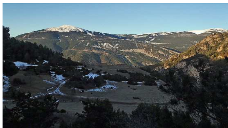
Port del Compte